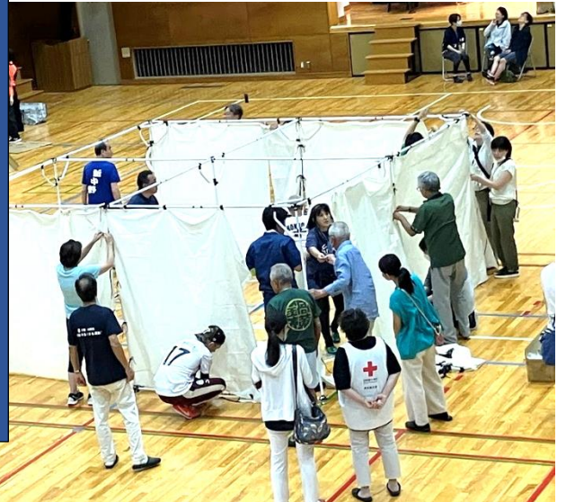
第二中学校体育館で災害時の布間仕切りの作成

「わくわく大作戦」は、小学生を対象に学校を会場として、毎年夏に行っている地域行事です。2024年7月の開催は25回目となりました。2024年度は第二中学校の生徒もスタッフとして参加しました。