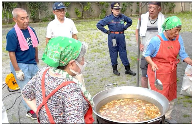
防災窯を使っでの炊き出し訓練

元日に発生した能登半島地震では5か月も断水が続く地域もありました。8月の日向灘を震源とする地震では崖崩れや液状化の被害もあり、南海トラフ地震も心配されています。 台風による記録的な大雨、土砂災害や河川の氾濫、洪水被害も他人事ではありません。 災害に備えるために今からできることを考え、実行しましょう！